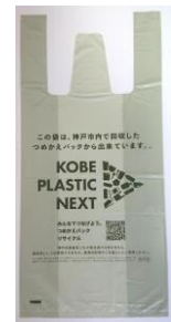
リサイクルごみ袋