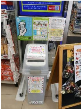
ウエルシア神戸魚崎北町店

2021年10月1日 神戸市と小売・日用品メーカー・リサイクラー16社によるプロジェクトチームを発足。 神戸市内の75店舗に回収ボックスを設置し、つめかえパックの分別回収をスタート。