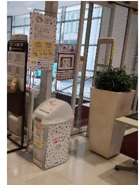
ダイエー神戸三宮店

2021年10月11日 フィルムリサイクル現場見学&技術検討会 (花王和歌山研究所パイロットプラント)